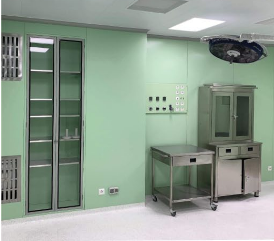
Реалізація чистих приміщень в приватній клініці «Verum» м. Київ