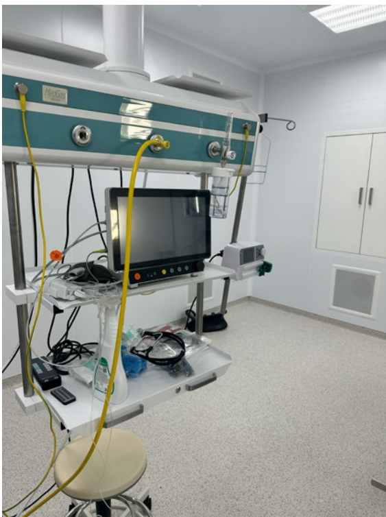
Виробництво та монтаж систем лікувальних газів в медичному центрі «НОВА» м. Київ